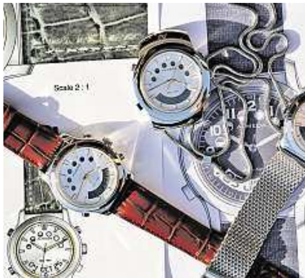
Praktisch: Diese Uhren warnen Patienten bis sechsmal täglich.

Die Neuheit aus Japan war begehrt und zwang als Konsequenz die schweizerische Uhrenbranche auf den Boden. Scholl musste sich